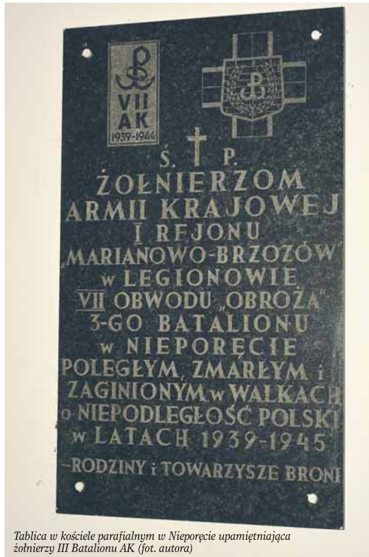
Tablica w kościele parafialnym w Nieporęcie upamiętniająca żołnierzy III Batalionu AK